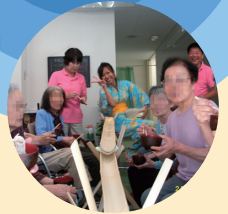
認知症高齢者のケア