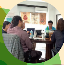
地域コミュニティの活性化